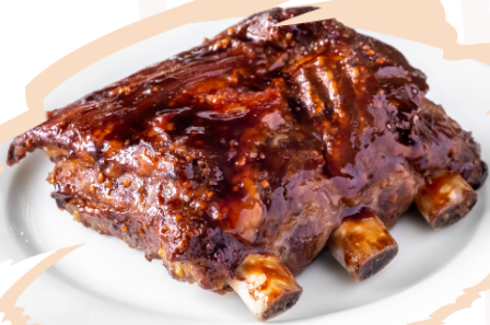
Costillas de Cerdo a la Barbacoa