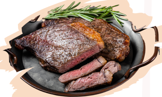
Tri Tip a la Barbacoa

Cada opción de carne viene con Ejotes, Macarroni con Queso, Ensalada de Papa, Pan de Elote, Postre, y opción de una Bebida Caliente o Fría.